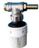
Control de Temperatura Individual