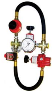
Control Automático de Temperatura