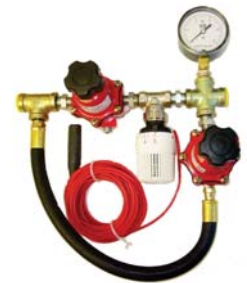
Control Automático (No Eléctrico) de Temperatura

Tel. (777) 311 9074 / 364 5988 / 317 9253 E-mail: ventas@evolucionagropecuaria.com www.evolucionagropecuaria.com