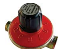
Regulador Manual (12 Criadoras)